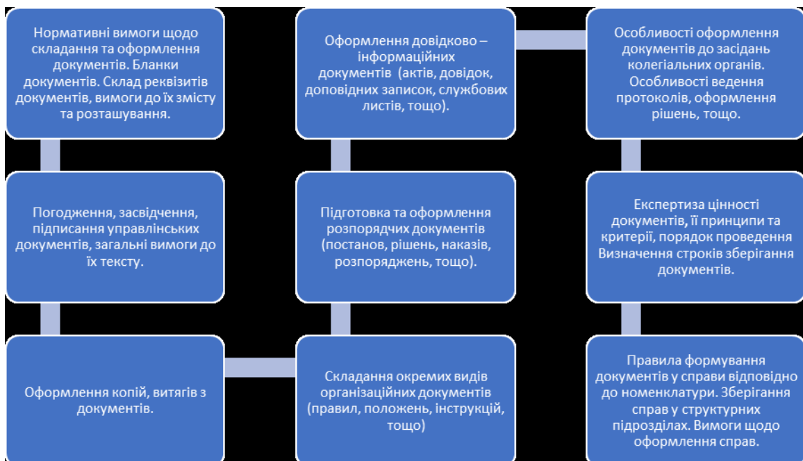
Рисунок 2. Комунікаційні складові роботи з документною інформацією

У процесі документно-інформаційної діяльності установи необхідно дотримуватися встановлених норм стандартизації та уніфікації документної інформації [3, 61]. Принциповим у встановленні комунікаційних зв'язків установи є напрям роботи з документною інформацією, спрямованою на підготовку і оформлення службових документів. Діловодна служба, а також працівники архіву / архівного підрозділу, які контролюють організацію документообігу на підприємстві, в своїй діяльності виділяють такі складові (рисунок 2).