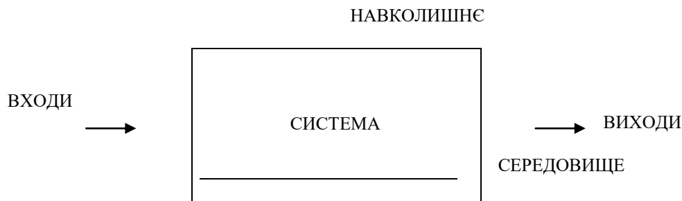
Рис. 1. Модель «чорної скриньки» (за Н. Б. Чорней)

впливати на неї, використовувати її як засіб, а зв'язки, що йдуть із системи ( виходи ), є результатами її функціонування, які або впливають на зміни у середовищі, або споживаються зовні системи [7, 100].