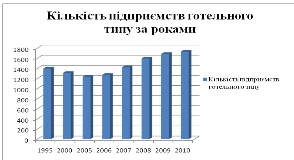
Рис. 1. Кількість підприємств готельного типу за роками [10]

нденцію зростання, що свідчить про актуальність розвитку готельно-ресторанної галузі, а збільшення цих показників свідчить про необхідність зростання потреби в трудових ресурсах ( рис.1, 2) [10].