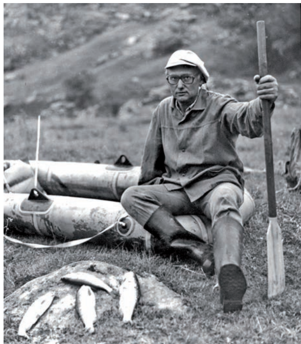
1986. Побужье. Возле с. Хошеватое.