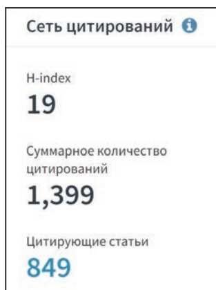
Рис. 2. Скриншот статистической информации с веб-страницы Web of Science (поиск по номеру идентификатора ResearcherID: S-2250-2019; данные по состоянию на 20.05.2020).