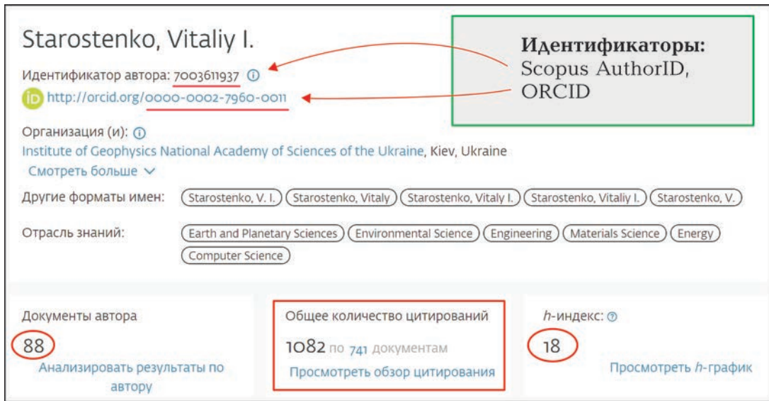
Рис. 1. Фрагмент профиля В.И. Старостенко в Scopus (информация по состоянию на май 2020 г.).