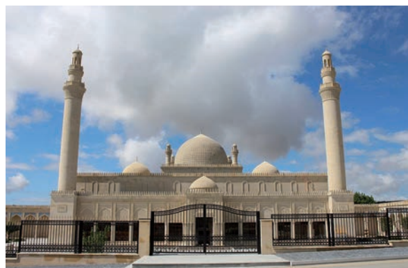
Рис. 3. Государственный историко-архитектурный памятник Джума мечеть в Шамахе после реставрации (2013 г.). Fig. 3. State historical and architectural monument Juma mosque in Shamakhi after restoration (2013).

около 10 баллов [Кондорская, Шебалин, 1977]. Согласно Ивановскому [Ивановский, 1899] «с моря хлынули огромные