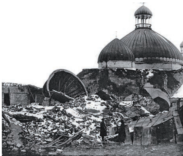
Рис. 2. Старейшая в Шамахе Джума мечеть после землетрясения 1902 г.. Fig. 2. The oldest mosque in Shamakhi, Juma mosque after the 1902 earthquake.