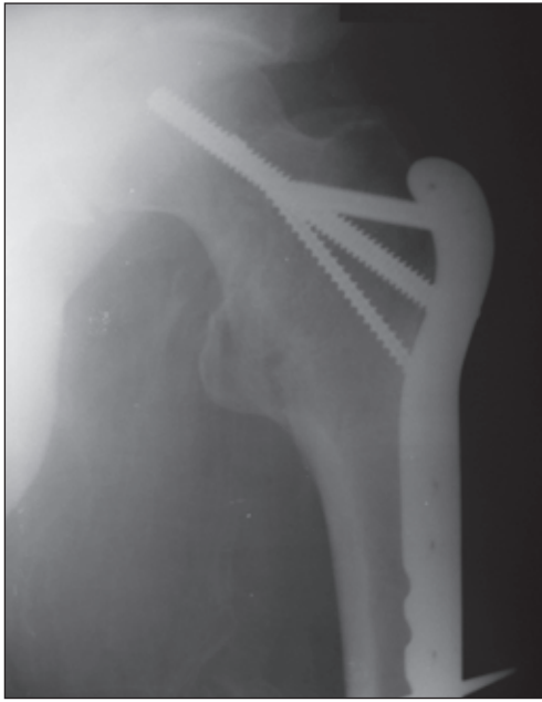
Рисунок 4. Фотоотпечаток послеоперационной рентгенограммы пациента Л. Анатомический изгиб проксимальной бедренной пластины не позволяет сместить пластину дистальнее, поэтому блокируемые винты 7,3 мм не проходят над дугой Адамса

мых для фиксации перелома в напряженном состоянии винтов шайба удаляется, винт 7,3 мм вкручивается до блокирования в пластине. Блокирование винтами диаметром 5,0 мм в диафизе бедра выполнялось из дополнительных разрезов без отделения мышц от кости. Рана послойно ушивалась, дренировалась. Операционная кровопотеря — 50–80 мл. Раневых осложнений не было.