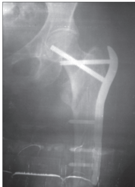
Рисунок 3. Фотоотпечаток послеоперационной рентгенограммы пациента П.