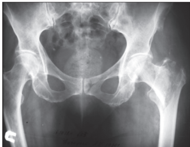
Рисунок 1. Фотоотпечаток рентгенограммы пациента П. Оскольчатый вертельный перелом правого бедра

Во всех случаях остеосинтез выполнялся проксимальной бедренной пластиной с блокируемыми винтами диаметром 7,3 мм для проксимального отдела и блокируемыми винтами диаметром 5,0 мм для диафиза бедра. Вмешательство выполняли под спинальной анестезией в положении больного на здоровом боку. Репозиция перелома выполнялась на операционном столе. Рентгенологический контроль выполняли в прямой и аксиальной проекциях по нашей методике [11]. Наружным доступом обнажалась подвертельная область, под рентгенологическим контролем по направляющим спицам перелом фиксировался проксимальной бедренной пластиной с блокируемыми винтами (рис. 2). Наличие овальных отверстий в таких пластинах дает возможность выполнить напряженный остеосинтез для диафизарной части перелома, а для метафизарных отломков пластина LCP используется как нейтрализующая, блокируемые винты диаметром 7,3 мм фиксируют метафизарные отломки без межфрагментарной компрессии. Для выполнения компрессии метафизарных отломков блокируемым винтом 7,3 мм мы подкла-