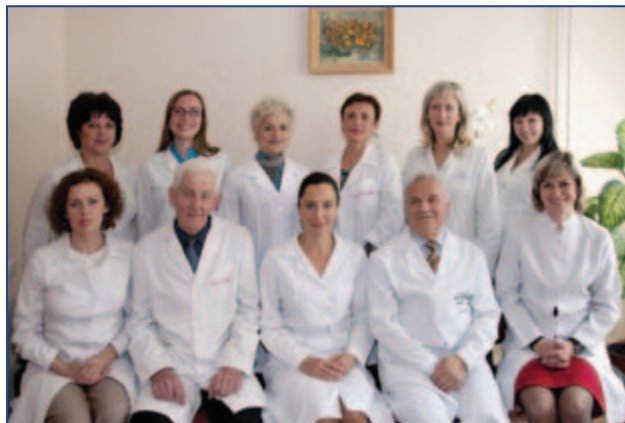
Співробітники кафедри клінічної імунології, алергології та ендокринології (2011 р.)

У зв'язку з навчально-методичною, науковою та клінічною перспективністю розвитку спеціальностей «ендокринологія», «клінічна імунологія», «алергологія», що зумовлено значним поширенням ендокринних та імунопатій, соціальною значущістю цих захворювань, наказом ректора Буковинського державного