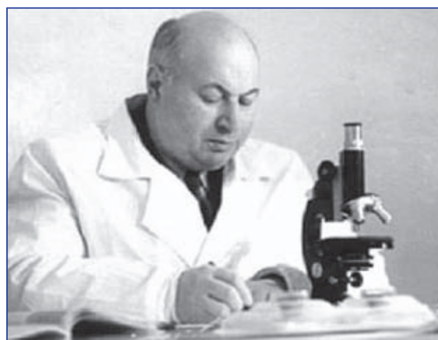
Професор Яків Давидович Кіршенблат, засновник нейроендокринологічної школи в Чернівецькому медичному інституті

Розвиток ендокринологічної науки на Буковині нерозривно пов'язаний з ім'ям видатного фізіолога-ендокринолога Якова Давидовича Кіршенבלата. Започаткований ним науковий напрямок — нейроендокринологія — залишається однією з провідних наукових тематик університету до сьогодні. Видано низку оригінальних монографій і навчальних посібників: «Практикум з ендокринології» (1969), «Загальна ендокринологія» (1971), «Порівняльна ендокринологія яєчників» (1973), «Телергони — хімічні посередники взаємодії між тваринами» (1974).