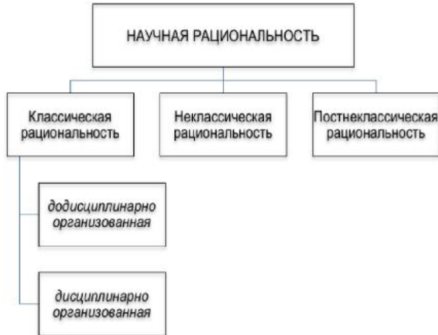
Рис. 1. Исторические типы научной рациональности

частей. С холистической позиции, весь мир - это единое целое, а выделяемые учеными и исследователями отдельные явления и объекты имеют смысл только как часть общности. В связи с этим, многими холистическими мыслителями делался вывод, что развитие мира должна направлять некая внешняя по отношению к нему сила, хотя, например, такой выраженный имманентист, как Г.Гегель, тоже был последовательным холистом.