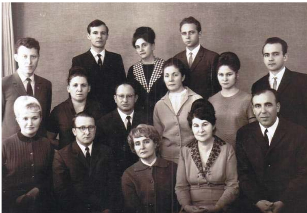
Колектив кафедри загальної гігієни в 1960-1970-і роки