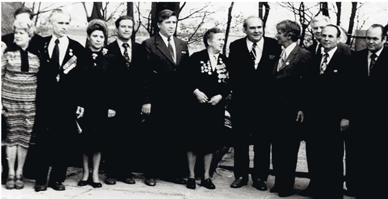
Співробітники академії на відкритті пам'ятника «Невідомому офіцеру»

У 1996 р. академію очолив академік, автор цього історичного нарису, зусиллями якого розпочався новітній рівень розвитку академії. Головним стрижнем діяльності став фундаментальний розвиток широковідомих у країні та за кордоном науково-педагогічних шкіл, які