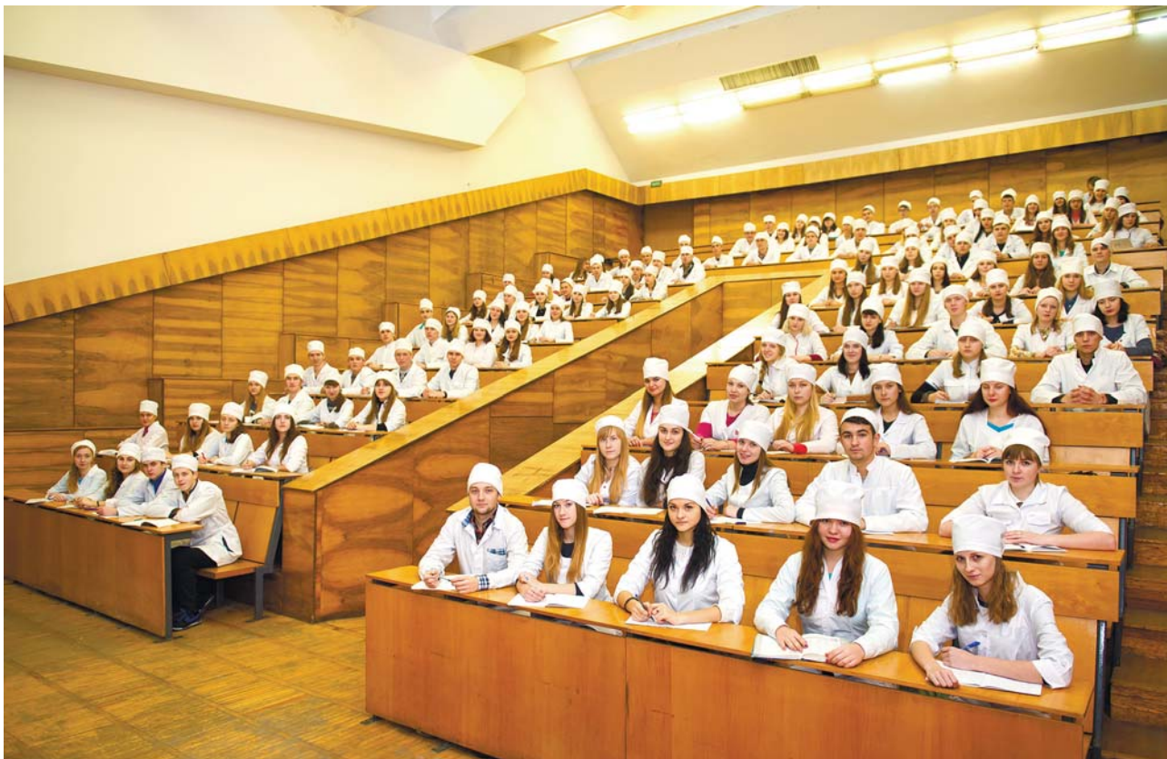
Лекція – фундамент знань

Березень 2016 р. – на VII міжнародній виставці «Сучасні заклади освіти – 2016» академія вкотре виборола високе звання переможця конкурсу «ГРАН ПРФ. Лідер наукової та науково-технічної діяльності», а за якість наукових публікацій удостоєна сертифікатом на підставі високих показників наукометричної бази Scopus.