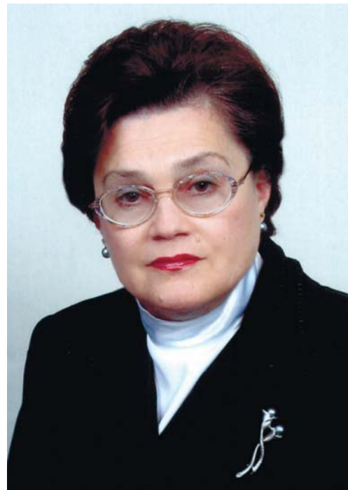
Ректор ДМА, член-кореспондент НАН та НАМН України проф. Л.В. Усенко

ля 9 кафедр академії; реабілітація хворих на ішемічну хворобу серця і ревматизм; дистанційне руйнування каменів у нирках і сечовому міхурі; ендопротезування великих і дрібних суглобів; розробка нових препаратів бактеріального походження; комп'ютерне забезпечення наукових досліджень і навчального процесу; розробка та впровадження нових методів діагностики; моніторинг стану навколишнього середовища; фундаментальні морфологічні, нейрофізіологічні, біохімічні дослідження.