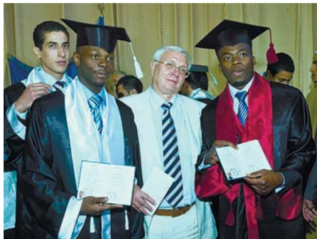
Посвячення в лікарі

Підготовка іноземних громадян на довузівському, додипломному і післядипломному рівнях (аспірантура, магістратура, клінічна ординатура) з 1990 року стала невід'ємною та вагомою часткою освіти в нашій академії для студентів з 52 країн світу.