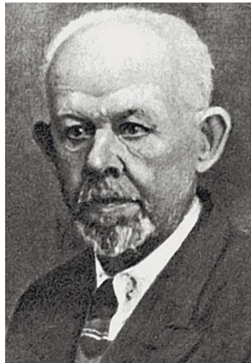
Перший ректор Катеринославської медичної академії проф. В.П. Карпов

У 1918 р. Вищі жіночі курси увійшли до складу Катеринославського університету, статут якого було розроблено і затверджено комісією під головуванням видатного вченого, академіка В.І. Вернадського. У зв'язку з реформою вищої освіти в Україні медичний факультет університету став самостійним вузом і отримав назву Катеринославська медична академія. Першим ректором призначено видатного вченого-гістолога, професора В.П. Карпова. Він залучив до академії досвідчені науково-педагогічні кадри, помітно зміцнив матеріальну базу (було придбано Олексіївський шпиталь, розпочато будівництво морфологічного корпусу), видано підручник «Начальный курс гистологии». На вшанування пам'яті першого ректора на честь 125-річчя від дня його народження було засновано наукову конференцію «Карповські читання» і медаль В.П. Карпова за найкращі науково-дослідні роботи з теоретичних дисциплін.