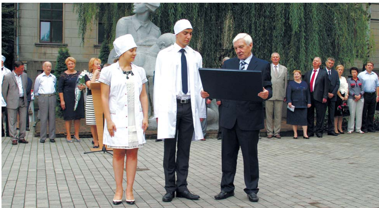
Посвячення в студенти

заклали підвалини успіхів сучасних науково-педагогічних напрямів діяльності Дніпропетровської медичної академії, завдяки чому вона стала одним з незаперечних лідерів вищої медичної школи України.