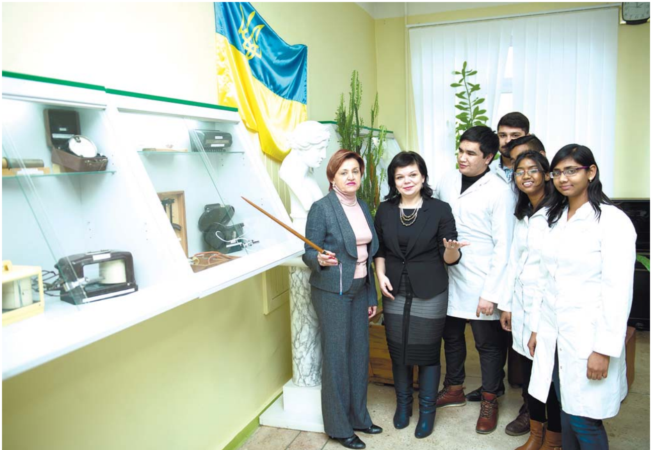
Іноземні студенти на кафедрі загальної гігієни

В умовах нашої академії це визначило напрями розвитку освіти, створення цілісної системи безперервного професійного розвитку лікарів, забезпечення поглибленої підготовки у відповідності змісту навчання реальним умовам роботи лікаря, використання новітніх освітянських форм тощо.