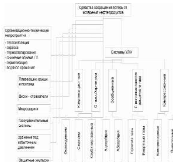
Рисунок 1 – Средства сокращения потерь от испарения (УЛФ – улавливание легких фракций)

Одним из наиболее перспективных направлений развития средств улавливания углеводородных паров является применение компрессионных систем улавливания легких фракций с использованием жидкостно-газовых струйных аппаратов. В таких системах сжатие паровоздушной смеси происходит за счет энергии высокоскоростных струй рабочей среды, находящейся в различных агрегатных состояниях (жидкость, двухфазная газожидкостная смесь). Эжекторные холодильные системы для улавливания легких фракций углеводородов обеспечивают высокую степень сокращения потерь, обладают малой металлоемкостью и капиталоемкостью, просты и надежны в эксплуатации. Работа эжектора устойчива при значительных колебаниях параметров и фракционного состава отсасываемого газа.