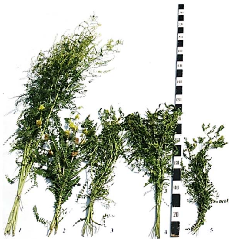
Рис. 1. Рослини роду Astragalus – фаза цвітіння: 1 – A. galegiformis L., 2 – A. ponticus Pall., 3 – A. cicer L., 4 – A. falcatus Lam., 5 – A. glycyphyllos L.

Загальний вміст цукрів значно збільшується до фази цвітіння. Найвищий цей показник був у A. glycyphyllos (20,00 %), найнижчий – A. galegiformis . Вміст протеїну у рослин роду Astragalus у цей період становив 14,00–24,42 %, аскорбінової кислоти відпо-