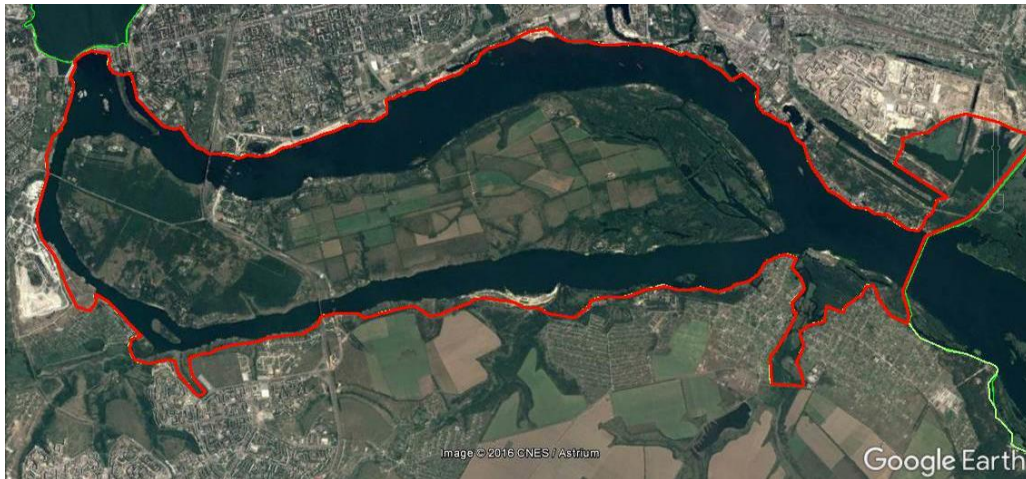
Рис. 1. Територія урочища, яка ввійшла до складу об'єкту Смарагдової мережі – Каховське водосховище