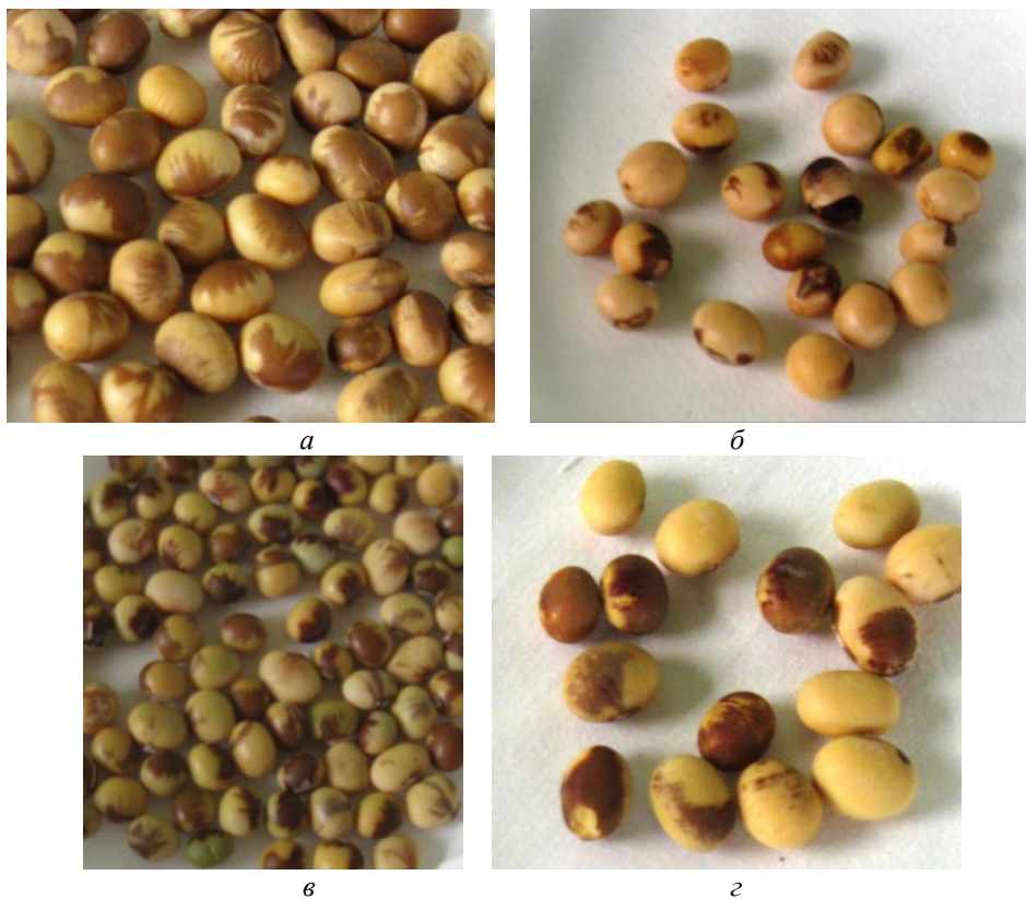
Рис. 2. Зразки насіння сої: а – сорт Медок, (безвірусне), б – сорт Кано, (містить ВМС), в – суміш сортів, без вірусного ураження, г – Кубань (містить ВМС), Полтавська обл.