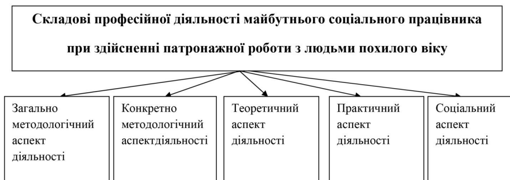
Рис. 1. Складові професійної діяльності майбутнього соціального працівника при здійсненні патронажної роботи з людьми похилого віку

Зазначені функції обумовлюють наявність складових професійної діяльності майбутнього соціального працівника при здійсненні патронажної роботи з людьми похилого віку (рис. 1).