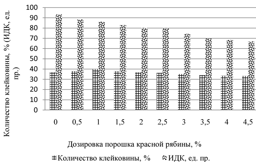
Рис. 2 – Влияние дозировок пищевого порошка красной рябины на количество и качество клейковины для макаронной муки

При внесении порошка более 1 % происходит постепенное уменьшение содержания клейковины (рис. 2). Связано это с тем, что в состав порошка входят различные органические кислоты. В условиях высокой кислотности белки клейковины не набухают, а пептизируются переходя в коллоидный раствор. Однако, не смотря на происходящее уменьшение количества клейковины, данный показатель при максимальной дозировке порошка (4,5 %) соответствует требованиям стандарта на макаронную муку (не менее 26 %).