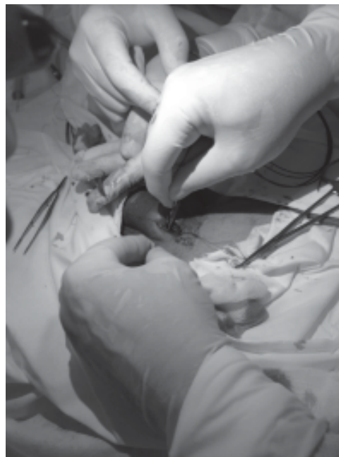
Рис. 2. Выделение глубокой дорзальной вены

Эффект операции оценивается по отсутствию или значимому уменьшению оттока венозной крови в сравнении с исходными флебограммами (рис. 4).