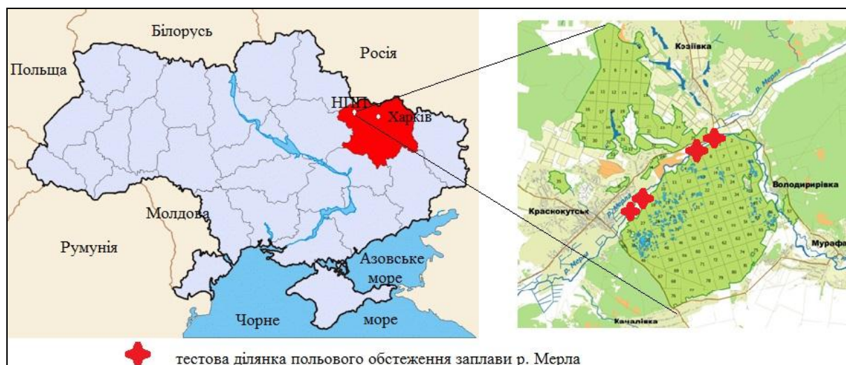
Рис. 1 – Ділянка дослідження