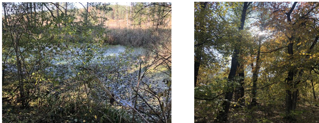
Рис. 2 – Досліджувана ділянка території заплави НПП «Слобожанський»

Трав'янистий покрив дуже нерівномірний, загальне проективне покриття місцями досягає 15-20%. Тут поширені кропива дводомна ( Urtica dioica ), чистотіл звичайний ( Chelidonium majus ), розхідник звичайний ( Glechoma hederacea ), гребінник звичайний ( Geum urbanum ), хвилівник звичайний ( Aristolochia clematitis ), м'яточник чорний ( Ballota nigra ), костриця велетенська ( Festuca gigantea ), кінський часник черешковий ( Alliaria petiolata ), вероніка дібровна ( Veronica chamaedrys ), конвалія звичайна ( Convallaria majalis ), тонконіг дібровний ( Poa nemoralis ), цибуля ведмежа ( Allium ursinum ), бузина чорна ( Sambucus nigra ), празелень звичайна ( Lapsana communis ), глуха кропива плямиста ( Lamium maculatum ).