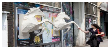
Фото 2. 3D плакат «Коні з вітрини магазину»

Сучасні розробники 3D моделей манекенів пропонують використовувати їхню продукцію для здійснення дизайнерами і художниками різноманітних проектів з антропометрії. Сьогодні антропометрія відіграє важливу роль у промисловому дизайні, дизайні одягу, ергономіці та архітектурі. Статистичні дані про розподіл розмірів тіла у представників різних рас використовуються для оптимізації параметрів вироблених промислової продукції. Також розробниками враховуються наукові досягнення культурної антропології, які стосуються появи нових видів людської діяльності, і змін у стилі життя сучасної людини. Приклад, рис. 1, 2 [19].