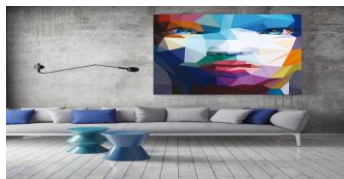
Фот. 1. 3D-плакат «Обличчя з трикутників в інтер'єрі»

Приклади творчих проектів, створених дизайнерами у форматі 3D плакатів, можна побачити на фото 1 і фото 2 [20, 21].