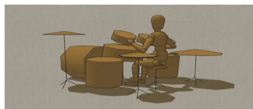
Рис. 1, 2. 3D модель манекенів «Музикант-фортепіано» і «Музикант-барабанщик»

Найбільш повне уявлення про творчий проект може створюватися за допомогою використання 3D друку. 3D принтер - це пристрій виведення тривимірних даних, як правило, об'ємної геометрії. Він дозволяє пошарово вирощувати спроектований студентами або викладачами об'єкт. Такі вироби володіють високою міцністю та є ідеальним інструментом для відтворення оригінальних, а не серійних об'єктів проектування. В Україні 3D друк почав активно використовувати не так давно, й потреба у ньому зростає.