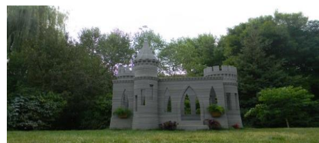
Фото 4. Замість будівництва - 3D друк з бетону

Винахідником А. Руденко (штат Міннесота, США), методом 3D друку, на площі 3х5 метрів було зведено з бетону модель середньовічного замку. Для великого принтера ним було використано спеціальні двигуни компанії «Mass Mind», розраховані на велике навантаження - фото 4 [5].