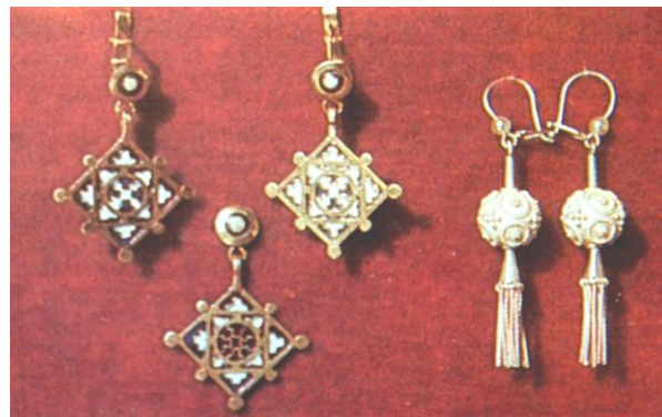
Рис. 2. О. Мінжулін. Комплекти жіночих прикрас 1986–1988:

О. Мінжулін. Отже, один комплект прикрас виготовлено в техніці гарячої емалі, інший – в техніці скані і зерні. Авторська назва срібного комплекту – «Мрія» (рис. 2, б). Слід також зазначити, що ці зразки виробів були представлені автором у підручнику «Реставрація творів з металу» [2, 189, 108].