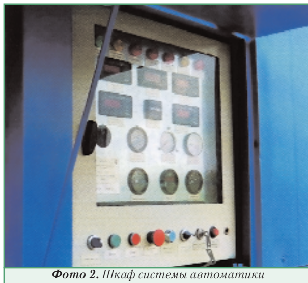
Фото 2. Шкаф системы автоматизации

Номенклатурный ряд станций ТГА может быть расширен нами согласно техническому заданию. Станции могут иметь: производительность — 5-5000 м 3 /мин; давление азота — 5-400 кгс/см 2 ; чистоту азота — 90-99,9 %; привод — электрический, дизельный или газопоршневой.