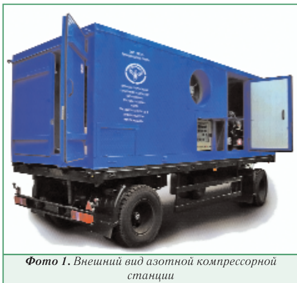
Фото 1. Внешний вид азотной компрессорной станции

Для сжатия воздуха в блочно-модульных азотных станциях применяются компрессоры собственного изготовления или ведущих мировых производителей. Привод компрессора может осуществляться от дизельного или электрического двигателей. В табл. 1 приведены основные характеристики станций типа ТГА.