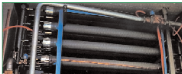
Фото 3. Мембранный газоразделительный блок станции