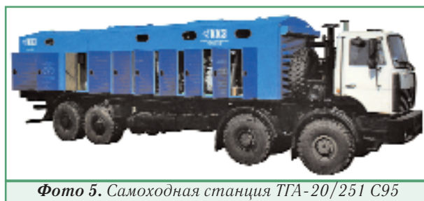
Фото 5. Самоходная станция ТГА-20/251 С95

Оборудование самоходных станций ТГА закрыто усовершенствованным капотом, который эффективно защищает его от внешних воздействий, способствует охлаждению и вентиляции в жаркое время года, а также позволяет эксплуатировать станцию при низких отрицательных температурах. В новой серии станций предусмотрено раздельное охлаждение дизеля и компрессора, что повышает их надёжность. Станции поставляются на шасси КАМАЗ, Урал, КрАЗ и МЗКТ.