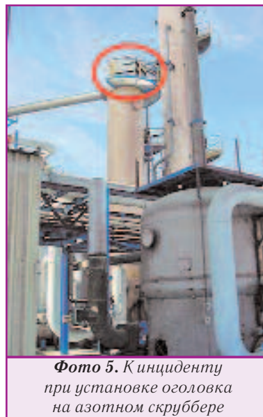
Фото 5. К инциденту при установке оголовка на азотном скруббере

Необходимым условием для предотвращения несчастных случаев является комплексный подход к обеспечению безопасности, когда анализируется и принимается во внимание максимальное число факторов, связанных с угрозами для жизни. Следующий пример наглядно показывает как расчёты при организации работ, так и эффективные меры по обеспечению безопасности, позволившие в результате быстрых и решительных действий спасти двух пострадавших.