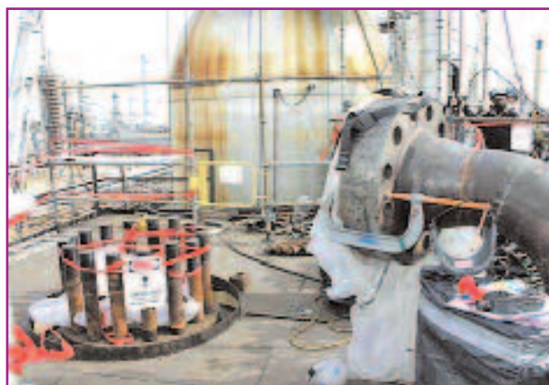
Фото 3. Верхний патрубок реактора нефтеперерабатывающего завода «Valero»

4.5. 5 ноября 2005 г. на нефтеперерабатывающем заводе компании «Valero» в шт. Делавер, США произошёл инцидент в реакторе установки гидрокрекинга [7]. Эта установка предназначена для получения лёгких фракций углеводородов из тяжёлых фракций с использованием катализатора и водорода высокого давления. Во время плановой замены отработанного катализатора реактор всё время продувался азотом, который выходил через верхний патрубок — единственное открытое место реактора (фото 3). После загрузки катализатора патрубок прикрыли полиэтиленовой пленкой и прижали деревянным щитом.