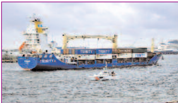
Фото 2. Сухогруз «Madeleine», на котором произошёл инцидент с утечкой аргона

В ограниченном пространстве корабля, заставленном контейнерами, количество инертного газа, которое может вытеснить кислород из воздуха до смертельно низких концентраций, гораздо меньше, чем на открытом воздухе. Повышенная опасность аргона, как уже отмечалось, обусловлена тем, что этот газ тяжелее воздуха и поэтому скапливается в пониженных местах.