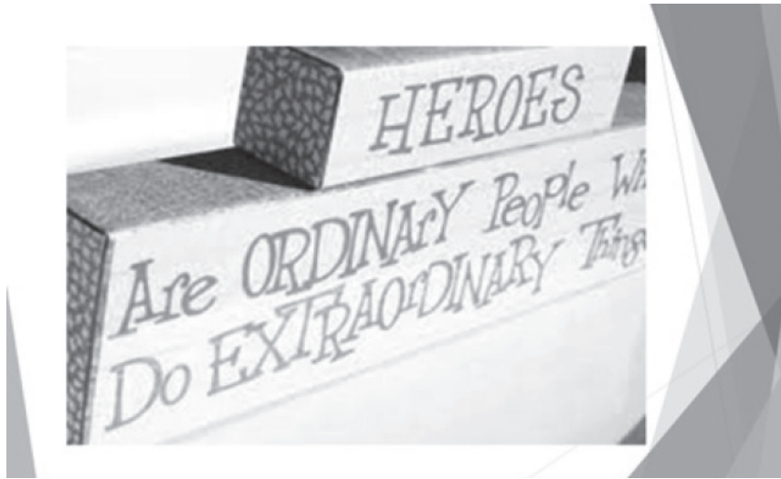
(Презентація «Unsung heroes» «Неоспівані герої» слайд № 3)

цитату: «Герої – це звичайні люди, які роблять надзвичайні справи»):