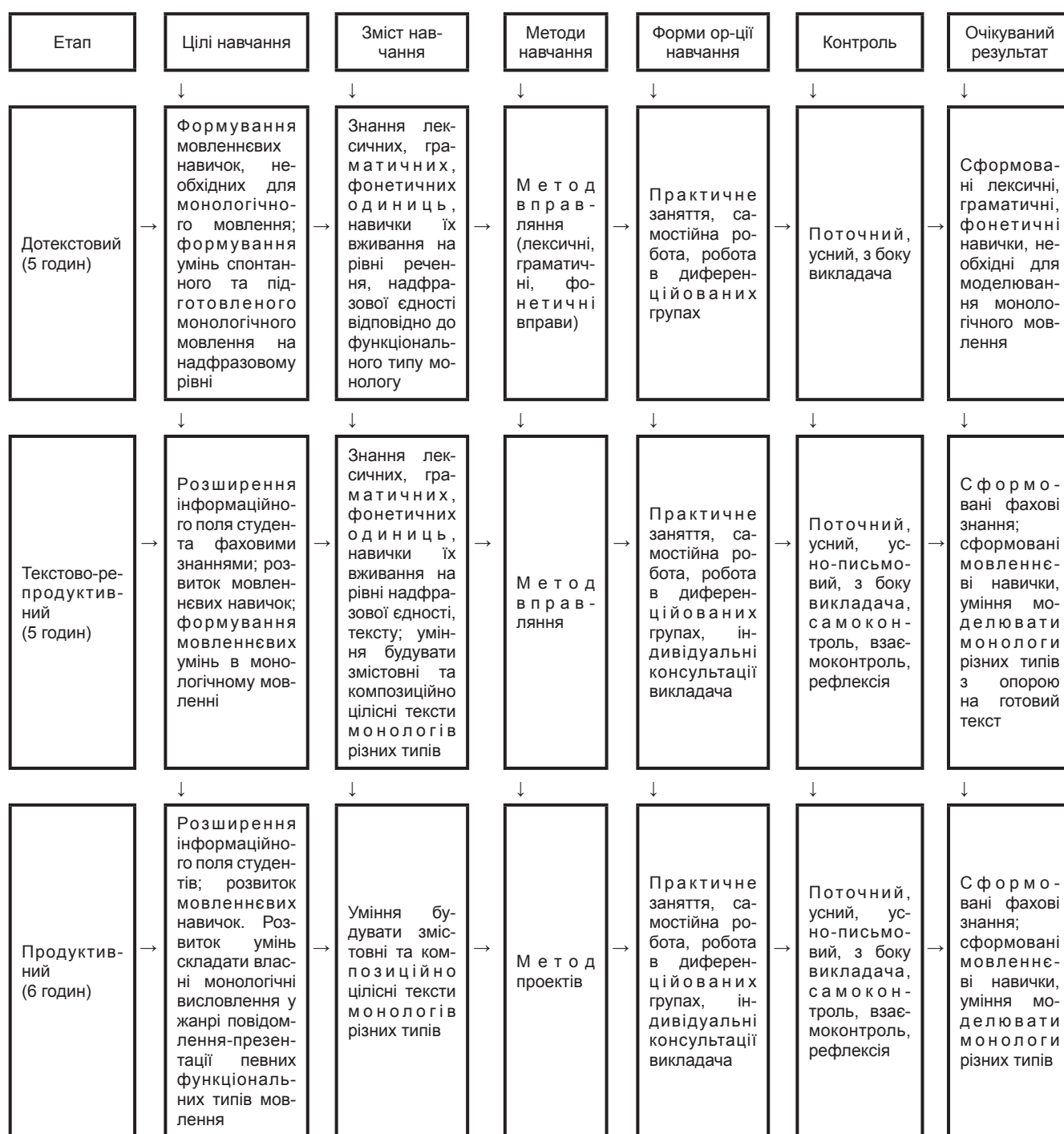
Рис. 2 Модель організації мікромодуля процесу навчання монологічного мовлення студентів спеціальності «Право»

Kuznetsova, N. Yu. (2014). Sistema upravlenia differentsirovannum obucheniem angliiskomy yazyku studentov neyazykovogo vuza v usloviakh neodnorodnosti uchebnykh grup (Кузнецова Н. Ю. Система управления дифференцированным обучением английскому языку студентов неязыкового вуза в условиях неоднородности учебных групп). Diss. Saint Petersburg. Print.