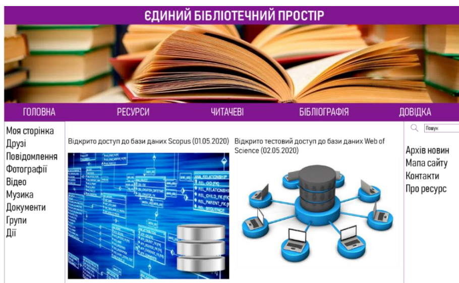
Рис. 3. Макет структури Єдиного бібліотечного простору

Єдиний бібліотечний простір є простором для функціонування освітньої документної комунікації за допомогою технологій глобальної мережі «Інтернет»; може бути корисним як при стаціонарній формі освіти, так і заочної та дистанційній, коли велику роль відіграють саме самодисциплінованість та самостійний характер навчання студентів. При створенні будь-якого подібного ресурсу постає необхідність в аналізованні думок аудиторії та її потреб, адже від того, наскільки вони будуть забезпечені, залежить успіх та кількість користувачів. Слід акцентувати саме на тому, що створюваний ресурс має чітку місію, яка полягає в об'єднанні документаційної бази бібліотек закладів вищої освіти та створенні комунікативного простору із навчальним та науковим характером ( рис. 3 ).