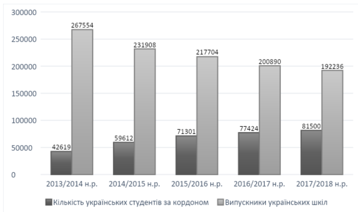
Рисунок 1. Кількість українських студентів за кордоном в співвідношенні з загальним обсягом випускників українських шкіл з 2013 по 2018 н. р.

Кількість українських студентів за кордоном в співвідношенні з загальним обсягом випускників українських шкіл за останні п'ять навчальні роки представлено на рис.1. [10, 14].