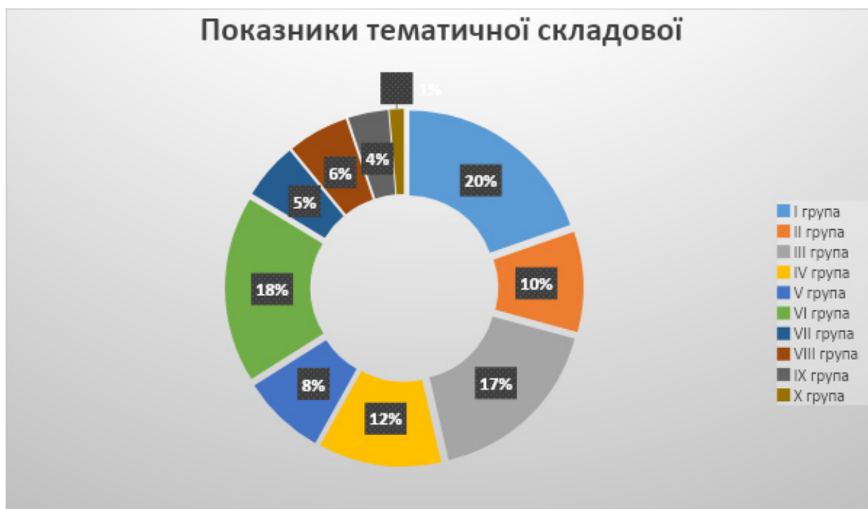
Діагр. 1. Загальні показники тематичної складової бібліотекознавчої періодики

бібліотекознавства, реорганізаційні зміни у формуванні краєзнавства, умовно належатимуть до десятої групи. Частка цих публікацій у досліджуваних виданнях, за вказаний період, складає 1% від загальної кількості тематичної спрямованості публікацій.