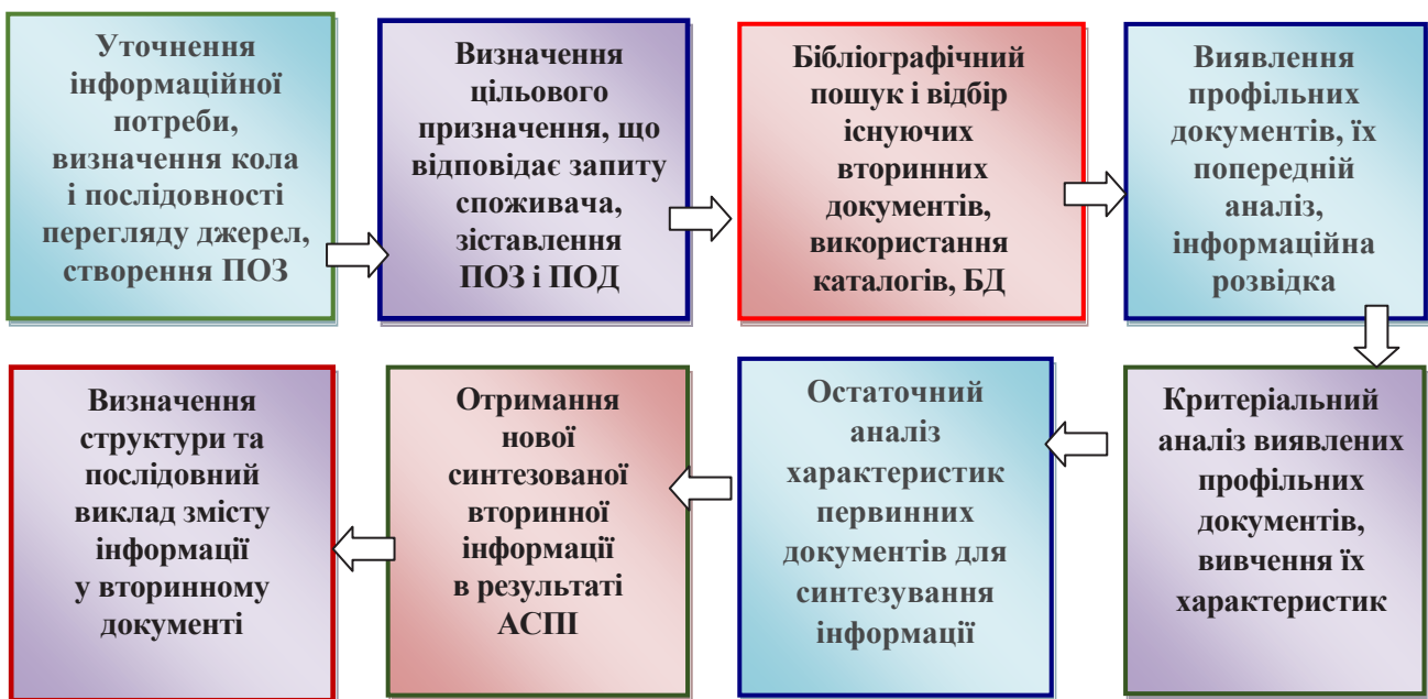
Мал. 1. Послідовність операцій підготовки інформаційного документа

Загальна методика підготовки інформаційного (вторинного) документа, що охоплює ряд послідовних операцій, подано на мал. 1.