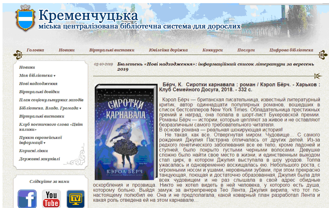
Рисунок 1. Зразок анотації на сайті бібліотеки

університету було запропоновано складання анотацій нових книжкових надходжень до Кременчуцької міської централізованої бібліотечної системи для дорослих. Анотації розміщувалися на сайті бібліотеки (рис. 1).