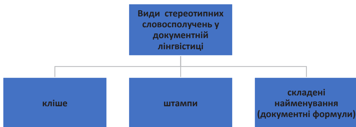
Рисунок 2. Види стереотипних словосполучень у документній лінгвістиці

Виклад основного матеріалу. Аналіз документних текстів різної видової віднесеності дозволяє виділити три види стереотипних словосполучень: кліше, штампи та складені найменування (документні формули), які беруть активну участь у побудові текстів (рис. 2).