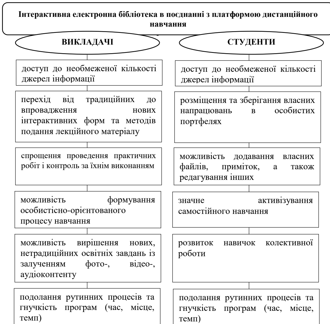
Рис. 2. Особливості використання інтерактивної електронної бібліотеки в поєднанні з платформою дистанційного навчання

платформою дистанційного навчання для викладачів та студентів представлені на рис. 2 [13]