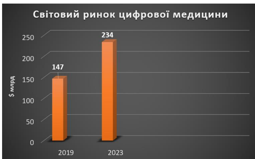
Рис. 1. Світовий ринок цифрової медицини

Виклад основного матеріалу. Згідно зі звітом Frost & Sullivan, очікується, що у 2023 р. світовий ринок цифрової охорони здоров'я досягне 234 млрд доларів порівняно зі 147 млрд доларів у 2019 р., з яких найбільшу частку ринку займатиме сегмент послуг у галузі медичних інформаційних технологій [14] (рис. 1).