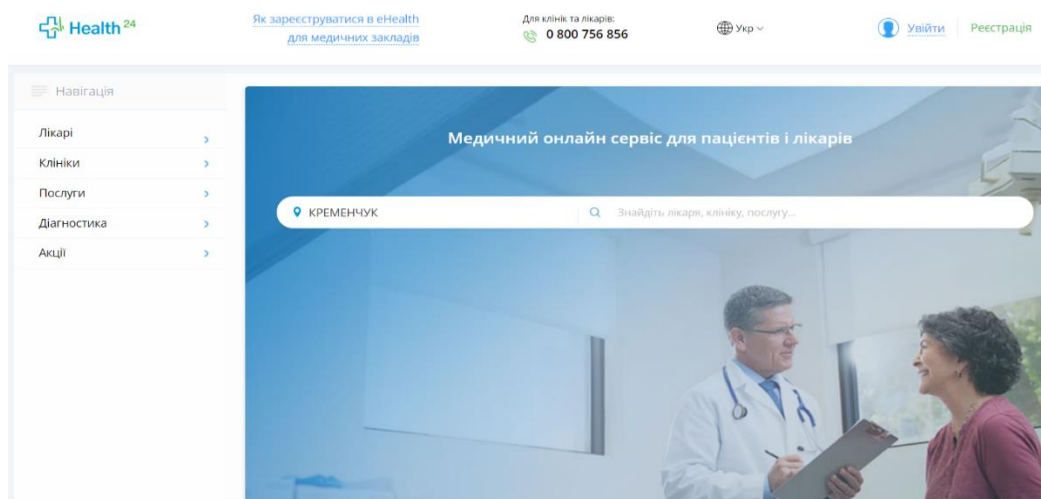
Рис. 2. Головна сторінка Health 24

1. Health 24 – повнофункціональна хмарна МІС, що інтегрує функціональні сервіси, які забезпечують роботу лікаря й медичного закладу відповідно до чинних стандартів медичного документообігу (рис. 2).