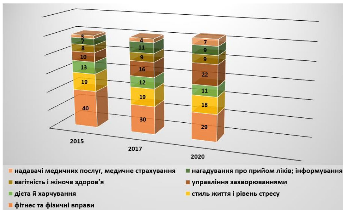
Рис. 5. Динаміка змін структури мобільних застосунків

Science, актуалізація цифрового простору у сфері охорони здоров'я зумовила зростання грошових вкладень: у 2020 р. інвестиції в цифрове здоров'я досягли рекордних 24 млрд доларів з новим щомісячним рекордом у грудні 2020 р. – 3,4 млрд доларів [13]. Ці тенденції стосуються і сфери мобільних технологій, що демонструє розширення можливостей мобільних застосунків. Варто відзначити, що з 2015 р. спостерігається певна динаміка змін структури мобільних застосунків, наявних у базі даних AppScript App Database. Так, у 2020 р. 47% застосунків було зосереджено на керуванні станом здоров'я порівняно з 27% у 2015 р., а частка застосунків для оздоровчого менеджменту (особливо програми для фізичних вправ та фітнесу) зменшилася [7] (рис. 5).