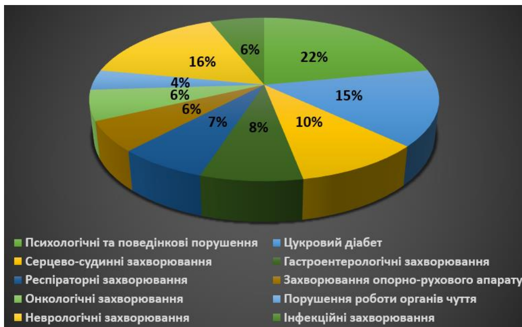
Рис. 6. Питома вага різних застосунків і програм для здоров'я

паразитарними хворобами, за інформацією AppScript, були зосереджені на COVID-19, демонструючи домінування пандемії над іншими інфекційними захворюваннями [7].