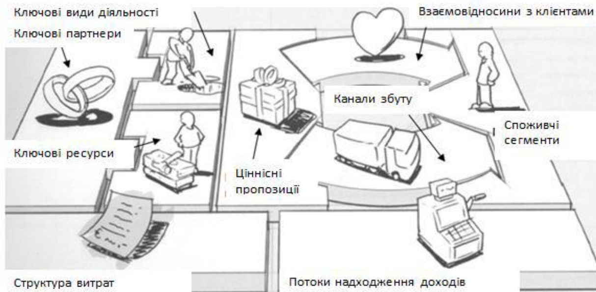
Рис. 1. Дев'ять структурних блоків моделі організації [5, 23]

Побудова канви моделі бібліотеки. Пропонуємо розглянути канву моделі, авторами якої є Александр Остервальдер та Ів Пінье [5], яка, безумовно, може бути використана в побудові ефективної моделі діяльності бібліотеки. На нашу думку, вона є досить простою і разом з тим системно відтворює ключові напрями і чинники побудови ефективної моделі організації. За основу взято дев'ять основних структурних блоків діяльності, що, за задумом авторів, охоплюють чотири основних компоненти діяльності: клієнтів, пропозицію, інфраструктуру та фінансову життєздатність організації (рис. 1).