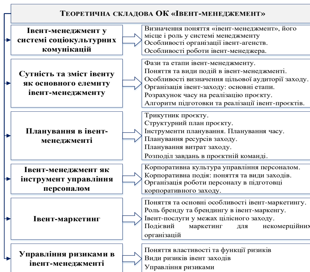
Рис. 1. Теоретичні складові курсу «Івент-менеджмент» в ОП «Соціальні комунікації та інформаційна діяльність» спеціальності 029 «Інформаційна, бібліотечна та архівна справа» у Національному університеті «Львівська політехніка»