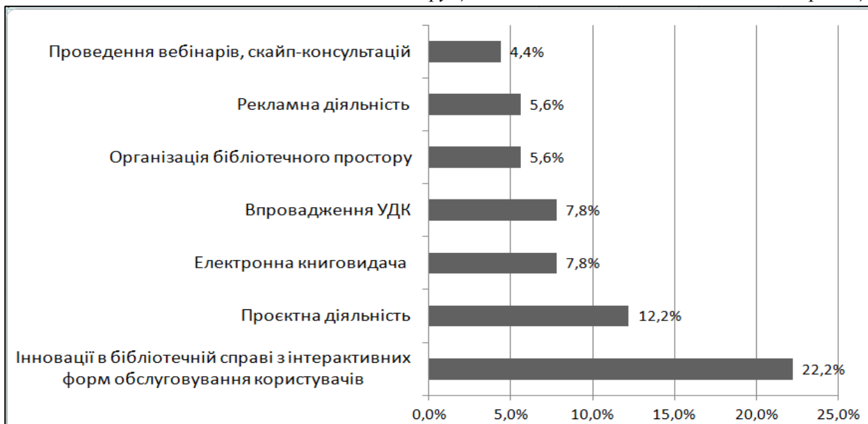
Рис. 1. Тематичні напрями, обрані бібліотекарями для підвищення кваліфікації