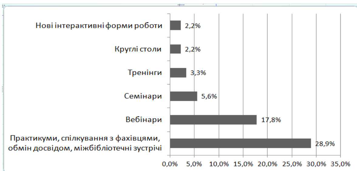
Рис. 3. Результати опитування щодо заходів з розширення професійного досвіду