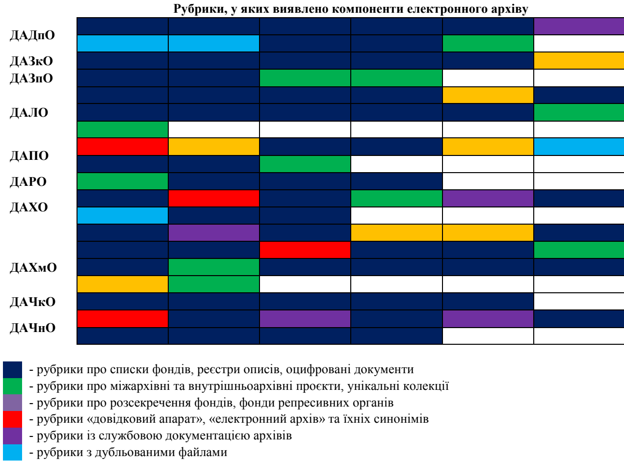
Рис. 1. Рубрики офіційних вебсайтів обласних архівів із 3-рівневою моделлю структури файлів електронного архіву

На офіційних вебсайтах обласних архівів із 3-рівневою моделлю структури файлів електронного архіву відкрито 17 розділів, які диференціюють базові поняття електронного архіву: оцифровані архівні документи і довідковий апарат. На наступному рівні – рівні рубрик – демонструється подальша деталізація і розкриття складу електронного архіву з поділом на оцифровані повнотекстові архівні документи і компоненти довідкового апарату. Виняток становлять лише вебсайти державних архівів Полтавської, Харківської, Хмельницької, Чернівецької областей, де зафіксовано підрубрику «Науково-допоміжний апарат». Розмежування оцифрованих оригіналів архівних документів і довідкового апарату ще на рівні розділу сприяє диференціації групування цих масивів документів під час подальшої рубрикації. На рисунку 1 відтворено не тільки змістовне наповнення рубрик, а й їхню послідов-