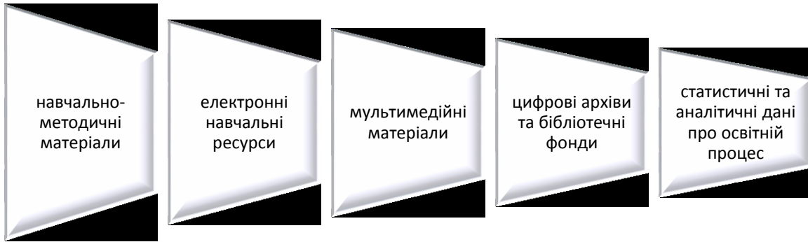
Рис 1. Перелік інформаційних ресурсів як головного компонента інформаційного супроводу освітньої сфери

Для циклової комісії викладачів бібліотечних дисциплін (далі – ЦКВБД) коледжу інформаційно-освітні ресурси є основою інформаційного супроводу: у плануванні й координації викладацької діяльності; створенні та оновленні методичних матеріалів; розробці освітніх та робочих програм; підвищенні кваліфікації викладачів; організації комунікації між членами комісії; впровадженні інноваційних форм навчання (творчі проекти, майстер-класи, мультимедійні презентації) [12].