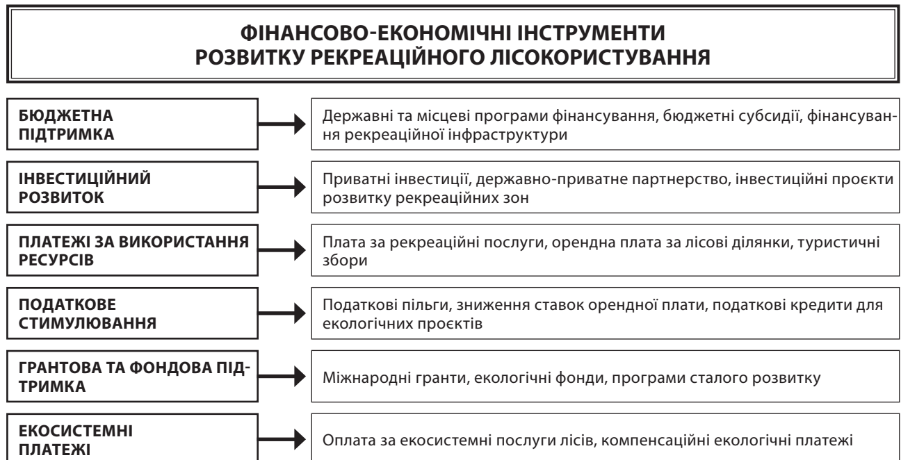
Рис. 3. Фінансово-економічні інструменти розвитку рекреаційного лісокористування

Необхідним інструментом також є екологічні фонди та грантове фінансування, що формуються за рахунок міжнародних програм, донорських організацій та екологічних фондів, а отримані кошти можуть використовуватися для реалізації проєктів сталого розвитку лісових територій, розвитку екотуризму, збереження