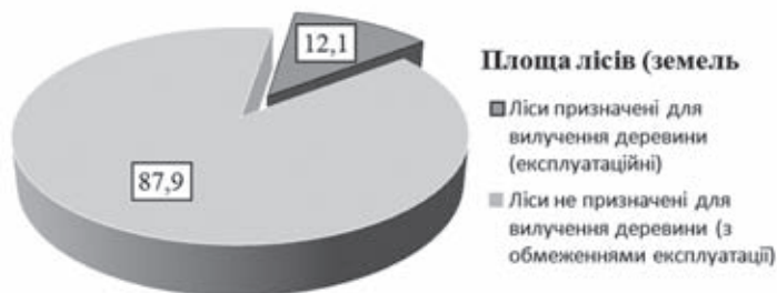
Рис. 3. Поділ земель за категоріями лісокористування ЄЕК/ФАО, ДП «Лісгосп», %