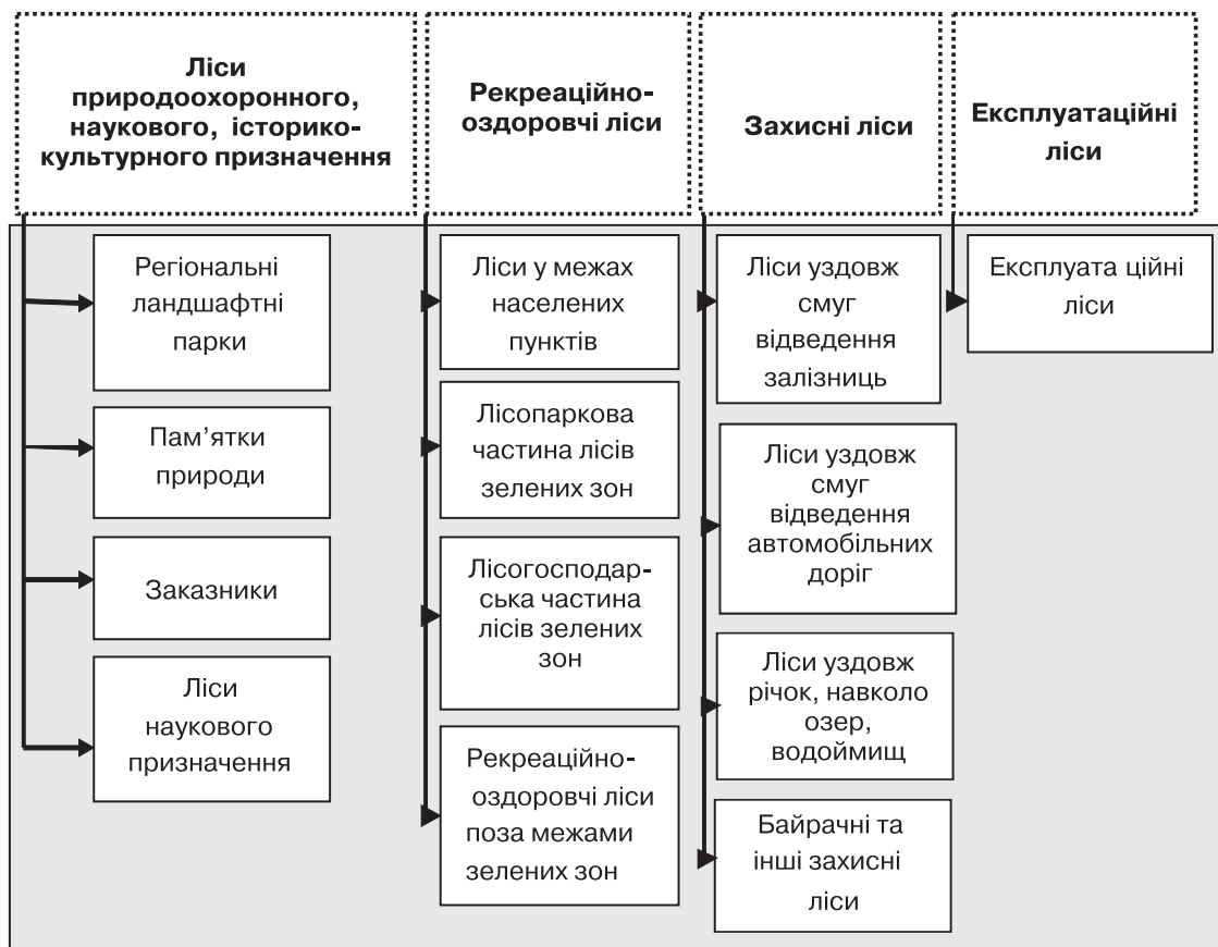
Рис. 1. Поділ земель лісогосподарського призначення на категорії землекористування