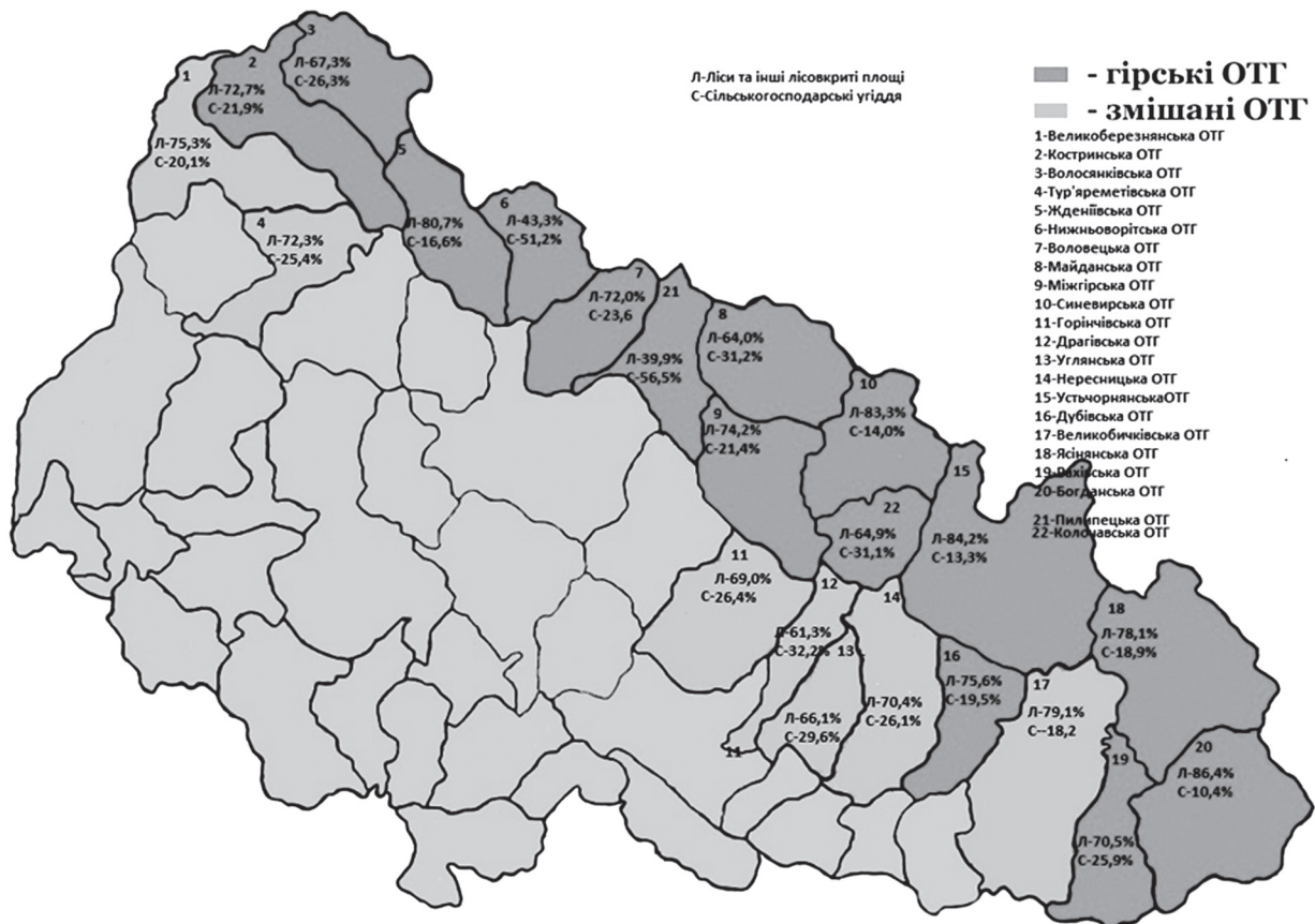
Рис. 2. Структура земельної площі ОТГ гірських районів