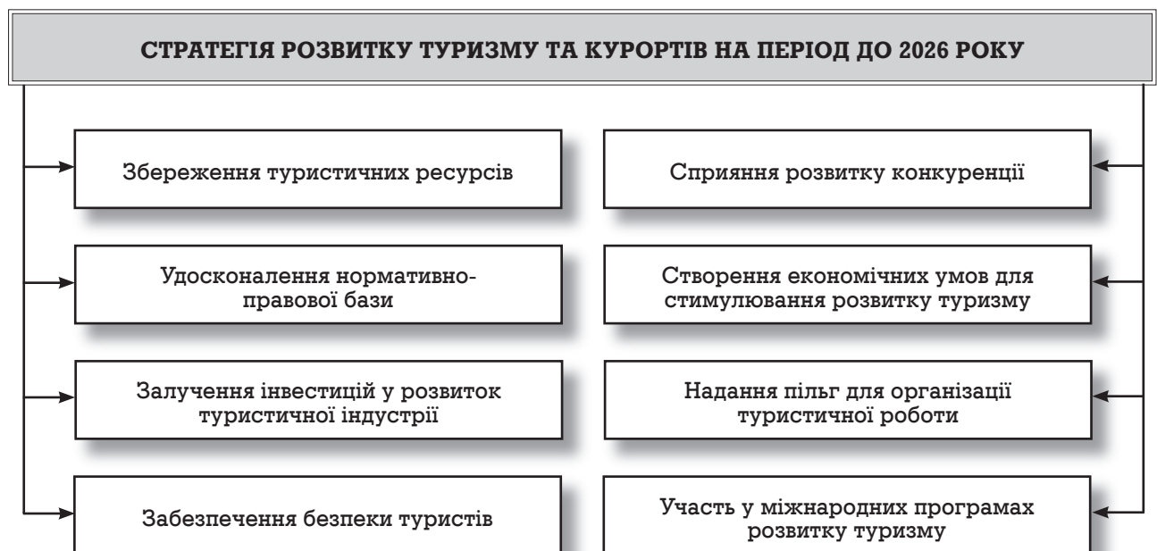
Рис. 2. Формування стратегії розвитку туристичних регіонів України

Примітка: *за вихідні показники взято показники 2015 р.