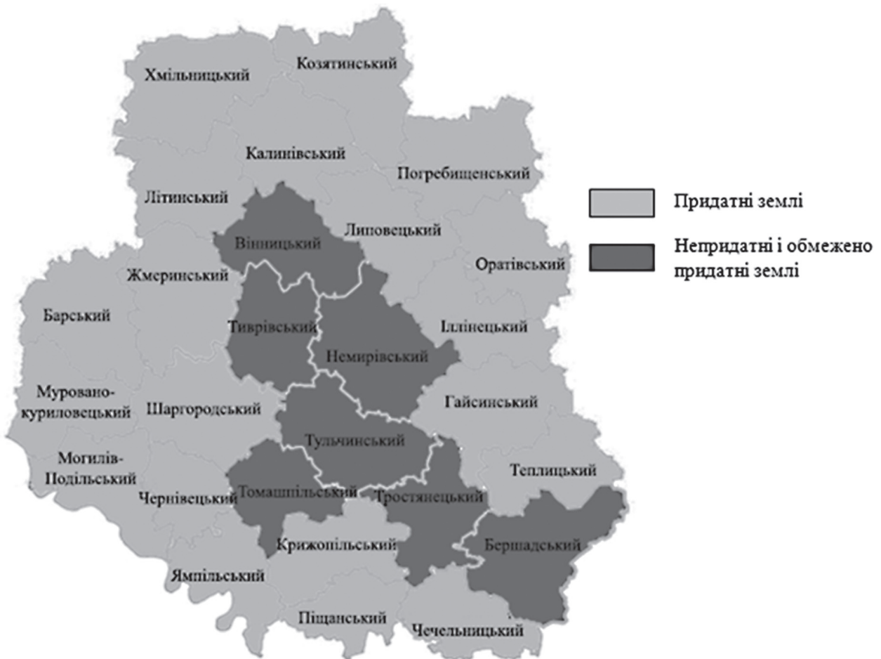
Рис. 2. Придатність земель Вінницької області для ведення органічного землеробства

Зокрема, на базі Іллінецького державного аграрного коледжу працює Міжнародна асоціація «БІОЛан Україна» та Консультативний центр Українсько-швейцарського проекту «Еко-Лан Україна». Вони не лише вирощують органічну продукцію, але й пропагують і надають консультаційну підтримку всім охочим.