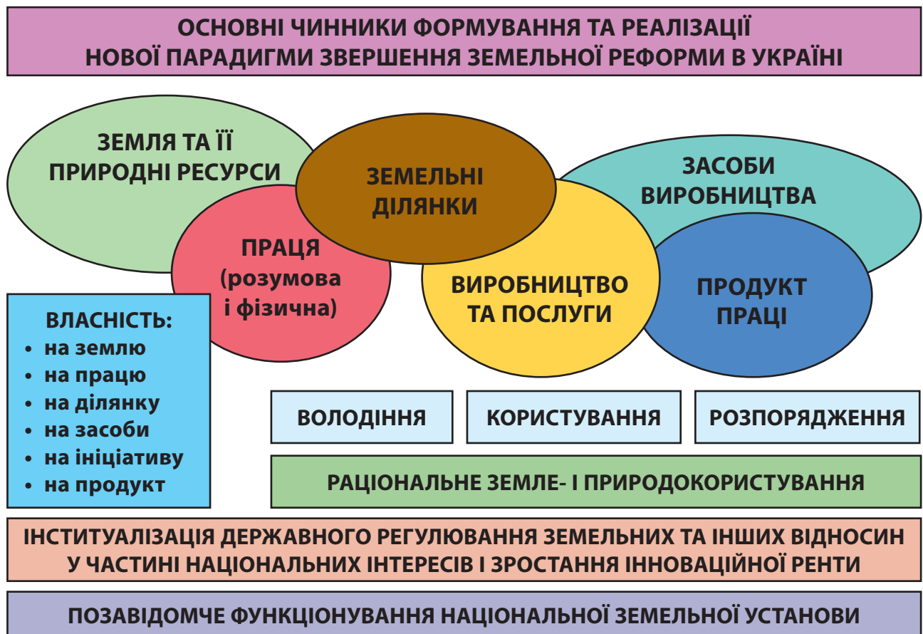
Рис. 2. Структурно-логічна матриця основних чинників як підґрунтя організаційно-правових засад (збалансованого) природокористування

Основні чинники нової парадигми звершення земельної реформи в Україні як підґрунтя організаційно-економічних орієнтирів (засад) збалансованого користування природними об'єктами, в тому числі в агросфері (рис. 3) [5].