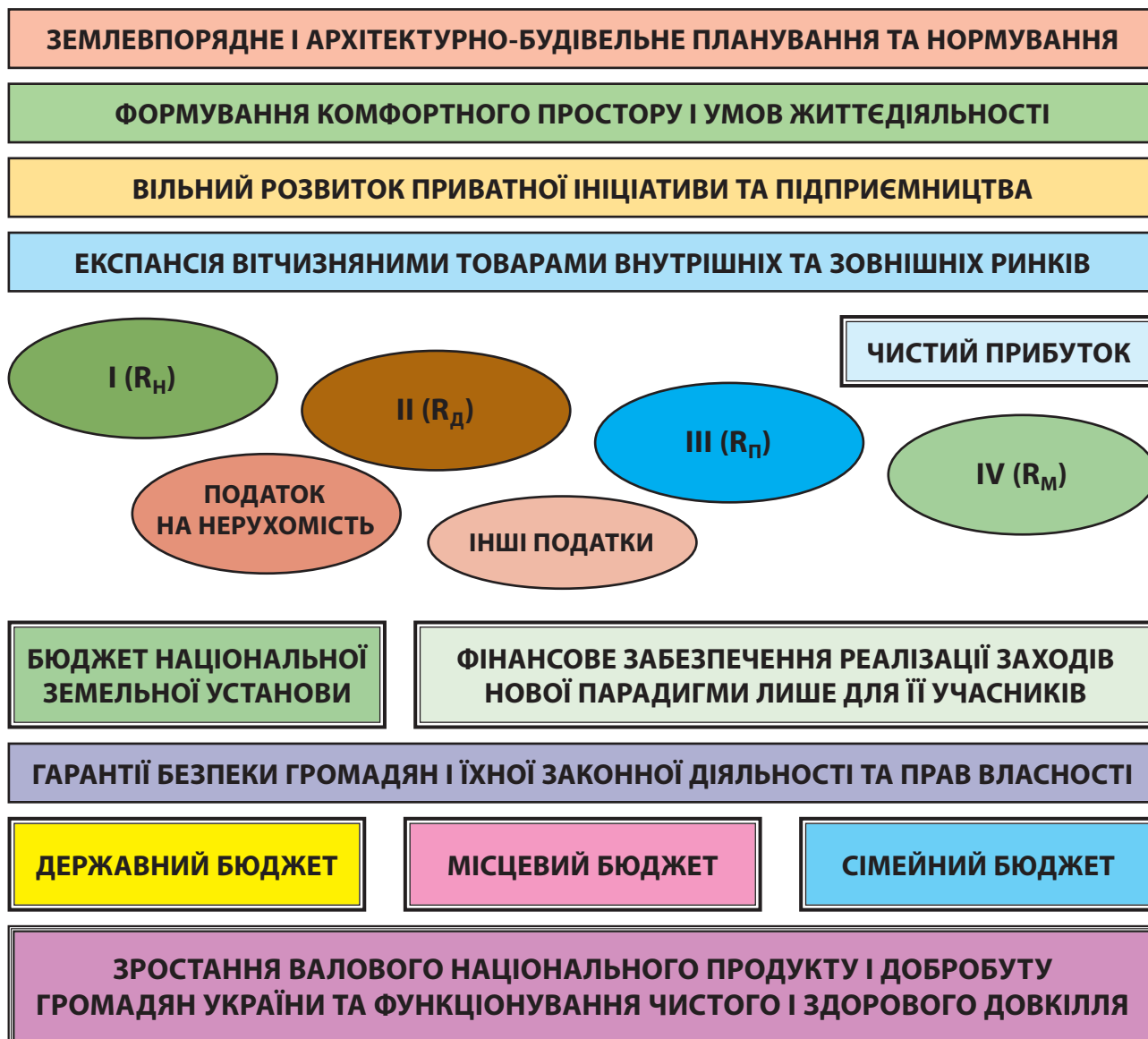
Рис. 3. Структурно-логічна матриця основних чинників нової парадигми звершення земельної реформи в Україні як підґрунтя організаційно-економічних орієнтирів (засад) збалансованого користування природними об'єктами, в тому числі в агросфері