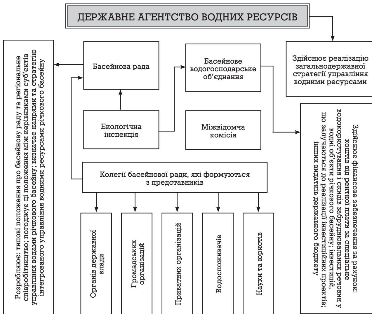
Рис. 3. Модель інтегрованого управління водними ресурсами України

зборів за спеціальне водокористування і скиди забруднювальних речовин у водні об'єкти річкового басейну; інвестицій, що залучаються до реалізації інвестиційних проектів, а також цільових внесків водокористувачів; видатків державного бюджету шляхом фінансування заходів загальнодержавної цільової програми комплексного розвитку річкових басейнів та в складі інших загальнодержавних програм; видатків з місцевого бюджету; міжнародних інвестицій, кредитів, грантів та компенсацій за нанесену шкоду транскордонним водотокам.