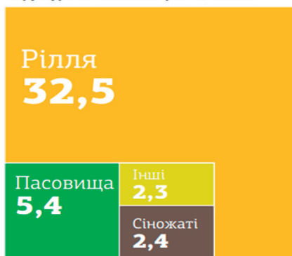
Структура с/г земель України 1 , млн га