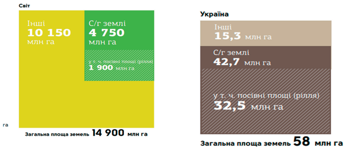
Рис. 1. Порівняльна структура земельних ресурсів Світу та України

Отже, найбільшу питому вагу в структурі сільськогосподарських земель України становлять орні землі — 32,5 млн га, пасовища — 5,4, сіножаті — 2,4 млн га. За даними Всеукраїнської аграрної Ради, усього під морато-