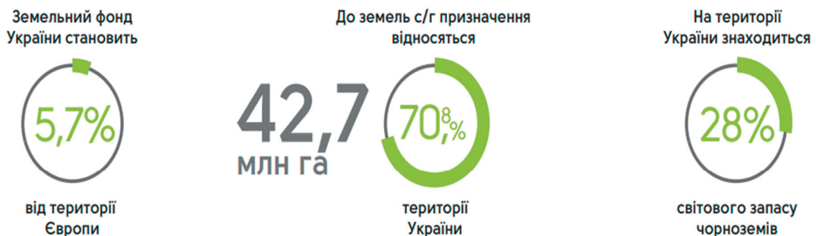
Рис. 2. Земельний фонд України у складі Європи