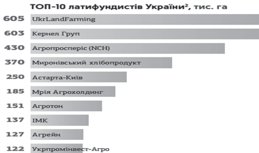
Рис. 5. Топ 10 латифундистів України

фонду, призвести до зменшення рівня родючого шару ґрунту, гумусу.