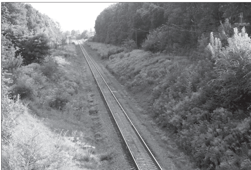
Рис. 1. Золотушник канадський уздовж залізничної колії, поблизу м. Житомир

Золотушник канадський використовується в традиційній, і в народній медицині як лікарський засіб — має сильну протизапальну дію [1, с. 65]. Проте ця рослина наносить велику шкоду не лише природі, а й лісовому та сільському господарству. Поки що цей процес можна в більшості областей України взяти під контроль, але через 5–8 років вже може бути пізно, якщо не вжити дієвих заходів прямо зараз на загальнонаціональному рівні, а ще краще — на міжнародному, спільно з країнами-сусідами України, перш за все — з Росією та Білоруссю, де проблема поширення золотуш-