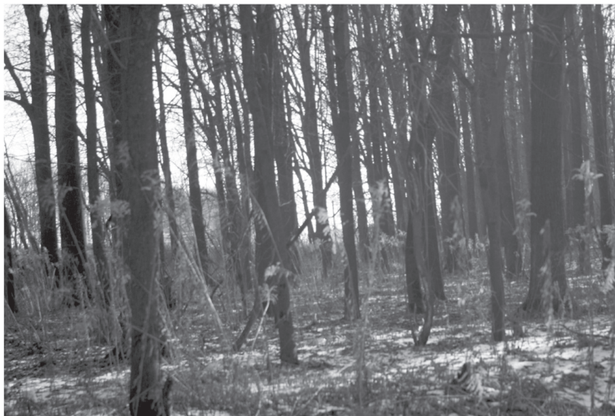
Рис. 6. Золотушник канадський у придорожніх лісосмугах

ти. Саме в цих осередках у межах Житомира золотушник досягає свого максимально розвитку — рослини виростають переважно до 1,5–2,0 м заввишки, а кількість рослин на одному квадратному метрі може перевищувати 100 шт.