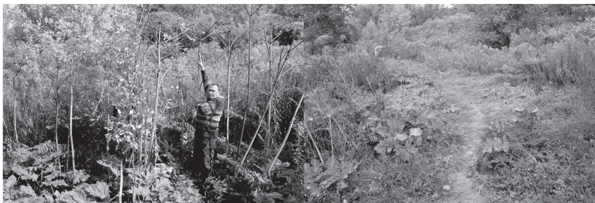
Рис. 7. Золотарник канадський та Борщівник Сосновського біля р. Путятинка

У центральній частині міста золотушник канадський трапляється лише епізодично й