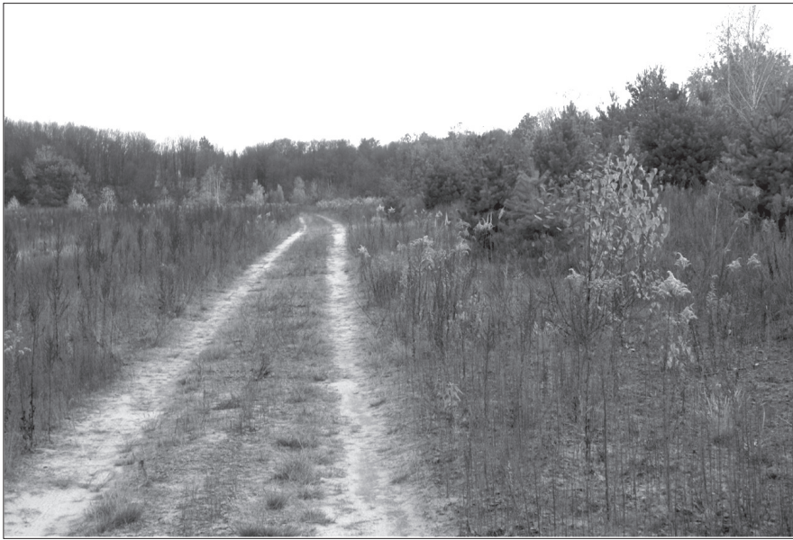
Рис. 5. Золотушник на лісовій галявині в листяному лісі, осінь 2016 р. (Тригірське лісництво)

Уздовж лісових доріг, особливо в кварталах з молодим, насамперед хвойним, лісом золотушник канадський має досить погані умови для розвитку, а відтак рідко утворює кущі з 5–10 і більше рослин, а також великі (понад 10 кущів) угруповання.