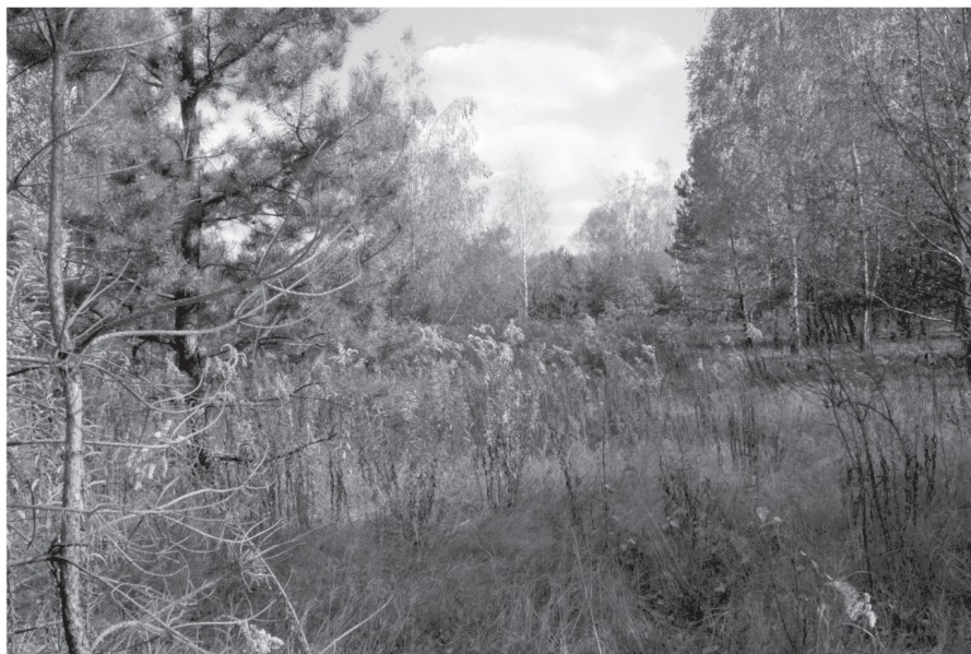
Рис. 2. Золотушник канадський на лісовій галявині. Тригірське лісництво ДП «Житомирське ЛГ»

Фотографували рослини з різних позицій у денний час доби, згідно з ботанічними вимогами та правилами з використанням дзеркальної фотокамери Canon EOS 1000D.