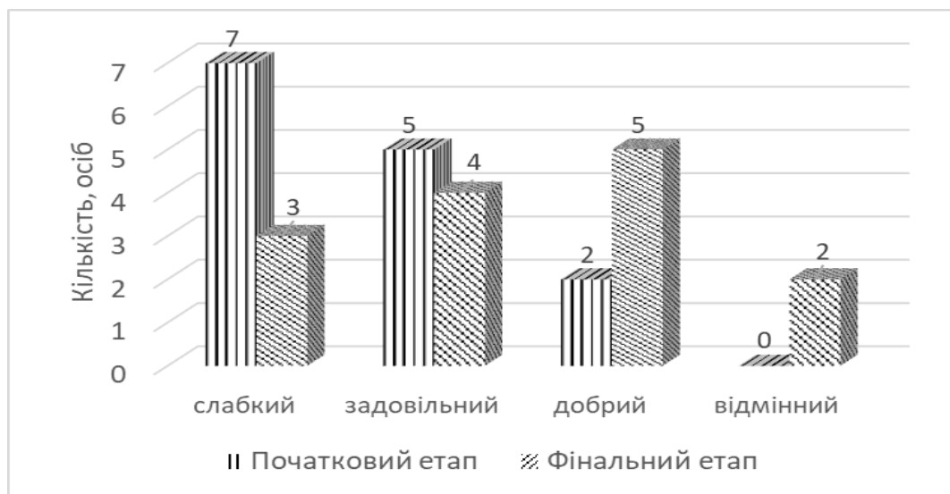
Рис. 1. Динаміка змін рівнів фізичної працездатності хлопчиків в результаті занять карате (n=14)

По завершенню педагогічного експерименту «слабкий» рівень фізичної працездатності залишився у 3 осіб (21 %), «задовільний» рівень визначений у 4 учасників (29 %), «добрий» – у 5 осіб (36 %), «відмінний» – у 2 хлопчиків (14 %). Середній показник індексу Руф'є цієї групи учасників по завершенню експерименту склав 7,9±1,0 бала (табл. 1). У графічному вигляді результати педагогічного експерименту, проведеного з учасниками групи хлопчиків, наведені на рисунку 1.