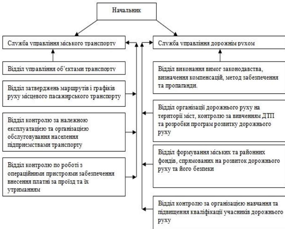
Рис. 3. Структура органу керування транспортом

Нехай структура органу керування транспортом має наступний вид і представлена на рис.3.