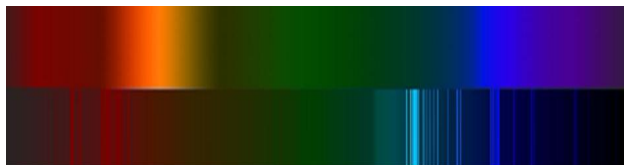
Рис.2. “Спектр знань” блоку матеріалу

де G(x, y, x_0) - “підспектр знань” (спектр тих частин, які служать для пояснення або розширення матеріалу) (рис.2).