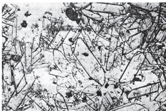
Рис. 1. Кристаллическая структура фосфогипса

При нагревании ФГ начинает терять кристаллизационную воду. При 150 °С интенсивность дифракционных максимумов двуводного гипса уменьшается, появляются новые линии 5,96; 2,97; 2,78; 1,83; 1,68; 1,65Å, отвечающие полуводному сульфату кальция. При температуре